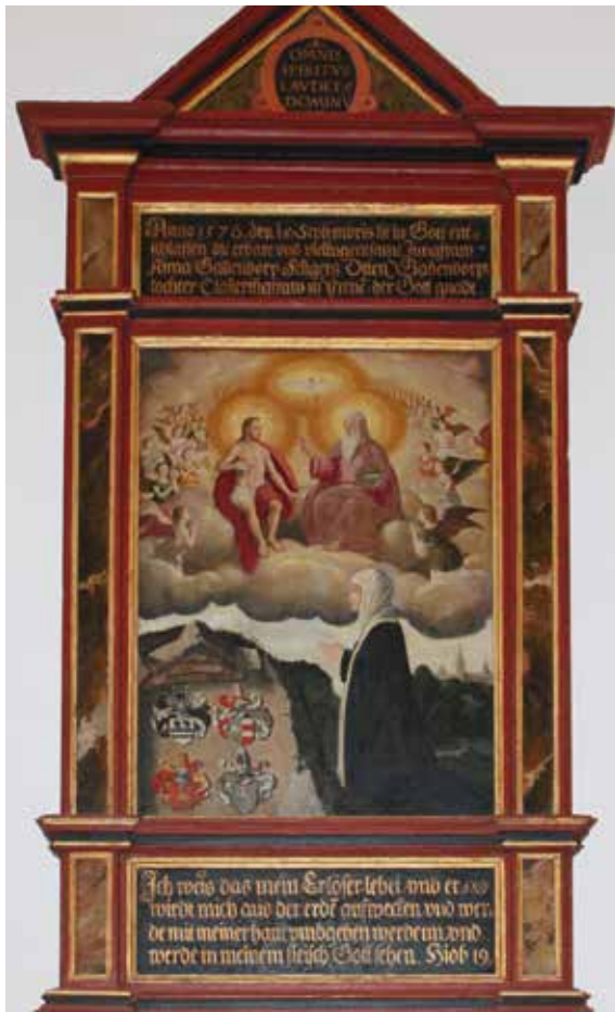
Abb. 67 Klosterkirche Preetz, Epitaph für die Konventualin Anna von Gadendorp (verst. 15. September 1576).

wird die Trinität hier nicht als Gnadenstuhl dargestellt, sondern die einzelnen ›Parteien‹ sind von einer Wolkenareole umgeben sowie einer Engelschar separiert (Abb. 67). 42 Deutlich wird, dass Gnadenstuhl-Ikonografien nach der Reformation (vorerst) weiterhin genutzt wurden, 43 beliebte Themen nicht einfach verschwanden, sondern