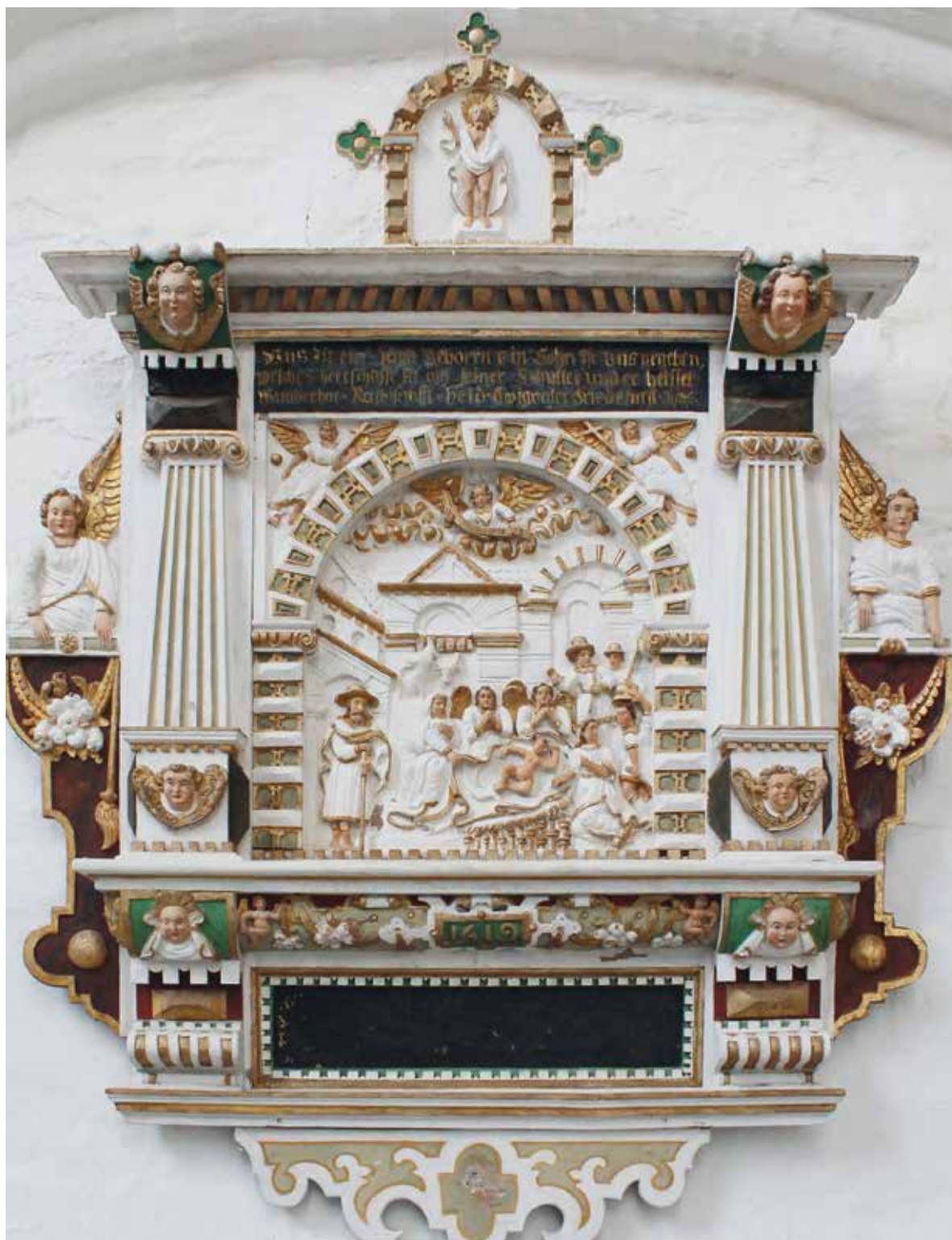
Abb. 65 Klosterkirche Preetz, Epitaph für Unbekannt (1619).