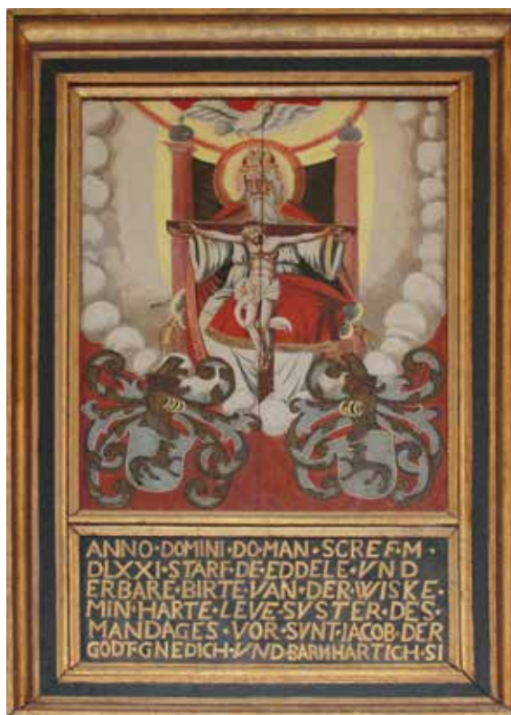
Abb. 66 Klosterkirche Pretz, Epitaph für die Konventualin Birte von der Wisch (verst. 1571), von ihrer Schwester gesetzt.

Das älteste Epitaph in Pretz ist für die Konventualin Birte von der Wisch vermutlich kurz nach ihrem Tod 1571 gesetzt worden (Abb. 66). 39 Es zeigt zentral die Darstellung eines Gnadenstuhls und gleich zweimal das Wappen der Familie von der Wisch. Während neue Themen also zumindest im Bild die Ausnahme bleiben, überdauern etablierte Themen. Durch eine Leiste abgetrennt befindet sich unter dem Gnadenstuhl ein Inschriftfeld, wo in einer für das Niederdeutsche unüblichen Kapitalis berichtet wird, dass die Schwester dieses Epitaph hat setzen lassen. Ihr Name wird nicht genannt, sie scheint sich durch eines der beiden Wappen vertreten zu fühlen, während das andere Birte repräsentiert. 40 Wichtig ist, dass auf diesem kleinen und schlichten Epitaph gleich zwei eigentlich mit der Reformation überkommene Bestandteile begegnen. Zum einen verlor die im Mittelalter für die Memorialkultur so zentrale Fürbittformel »DER / GODT · GNE-DICH · VND·BARMHARTICH · SI« mit der